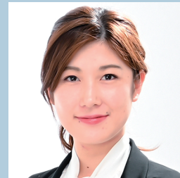
株式会社食の会 代表取締役 /フェルメクテス株式会社 共同経営者